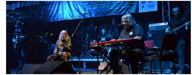
The Plastic People of the Universe

Reservierung erbeten unter: www.regensburg-1989.de Eintritt frei