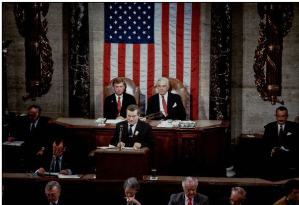
November 15, 1989 - Washington, District of Columbia, U.S - Polish Solidarity leader and Nobel Peace Prize winner Lech Walesa addresses a joint session of the US Congress in Washington DC., November 15, 1989. Washington U.S.

kontrollierten Gewerkschaften formierten und gegen die Nomenklatura wandten.[40] Für die ILO stellte dies aufgrund ihres Organisationsprinzips, des tripartism , eine besondere Schwierigkeit dar. Nach heftigen Diskussionen setzte sich hier nach der Anerkennung der Solidarność in Polen (August 1980) die Auffassung durch, die Vertreter derselben und nicht die der kommunistischen Parteien seien als Delegierte anzuerkennen. Nach der Proklamation des Kriegsrechts im Dezember 1981 führte dies schließlich zu einem Eklat, der in einem Ausschlussverfahren Polens aus der ILO geendet wäre, hätte sich nicht 1989 der Regimewechsel vollzogen.[41] Mit dem Regimewechsel jedoch setzte ein Umdeutungsprozess ein, innerhalb dessen Solidarność nicht länger als Gewerkschaft, sondern als eine Freiheitsbewegung galt.[42] Daran waren die Führer derselben maßgeblich beteiligt. Während die Forderungen der Arbeiter 1980 klar an ein sozialistisches Regime gerichtet gewesen waren und diese keineswegs einen Umsturz planten, sondern vielmehr die proklamierten sozialen und politischen Rechte innerhalb des Sozialismus einforderten,[43] wurde nun Solidarność im Sinne der Systemtransformation aktiv überhöht und so aus dem Sozialismus heraus und in eine neue Zeit der politischen und ökonomischen Freiheit überführt. Am sinnfälligsten lässt sich dies an Lech Wałęsas vielgeachtete Rede vor dem Kongress der USA im November 1989 festmachen.[44]